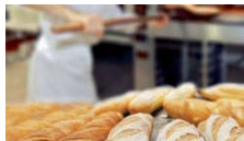
Fournil, boulangerie, pâtisserie, ...