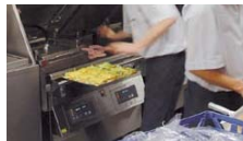
Restaurant, Fast Food, Food Trucks, ...