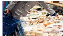
Grande distribution, poissonnerie, ...