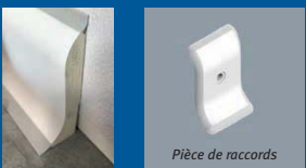
Pièce de raccords