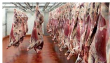
Boucherie, abattoir, salaison, ...