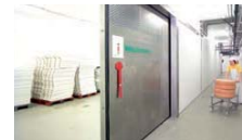
Usine agro-alimentaire, fromagerie, ...