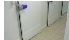
Chambres froides et locaux de surgélation