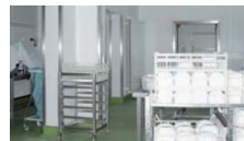
Collectivités locales et territoriales